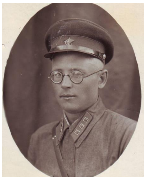
Арсеньев (1938 г.)